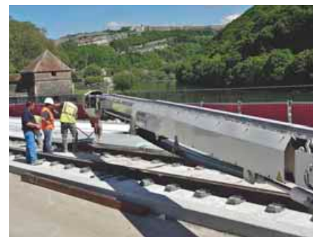
29 MAI 2013 : LE BÉTON EST COULÉ SUR LE PONT DE GAULLE. EMILE JOLY