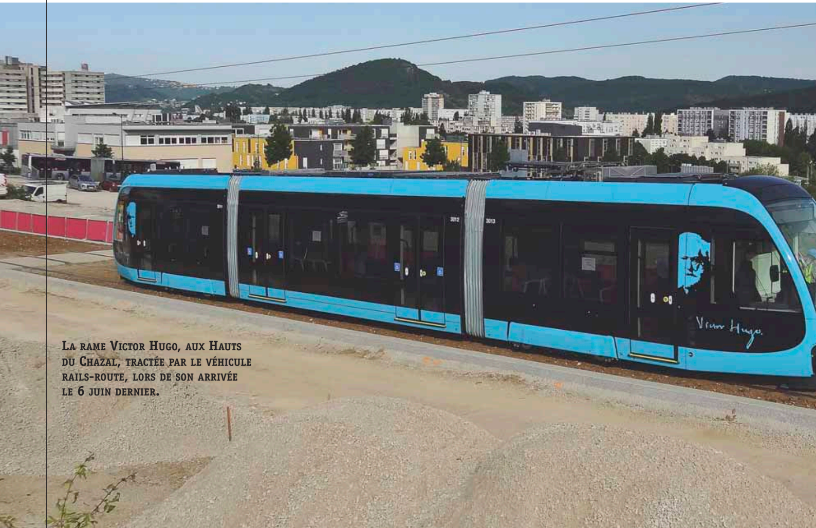
LA RAME VICTOR HUGO, AUX HAUTS DU CHAZAL, TRACTÉE PAR LE VÉHICULE RAILS-ROUTE, LORS DE SON ARRIVÉE LE 6 JUIN DERNIER.

Avant sa mise en service, une ligne de tram passe par 3 grandes étapes: les études, les travaux et les essais. À l'occasion des premiers tests en ligne de cette rentrée, le projet du Grand Besançon franchit donc un nouveau palier majeur. Ces essais, qui se dérouleront tout d'abord aux Hauts du Chazal, permettront d'évaluer le fonctionnement des rames en situation réelle. Dans la foulée, la conformité de l'infrastructure sera contrôlée sur toute la ligne, au fur et à mesure de la finalisation du chantier.