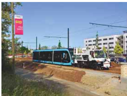
6 JUIN 2013 : LA RAME VICTOR HUGO REMORQUÉE JUSQU'AU CENTRE DE MAINTENANCE. PIERRE HOSCH

Chaque jour, nous mettons à l'honneur sur le site internet du tram les photos que vous nous envoyez. Retour sur vos plus belles photos du jour :