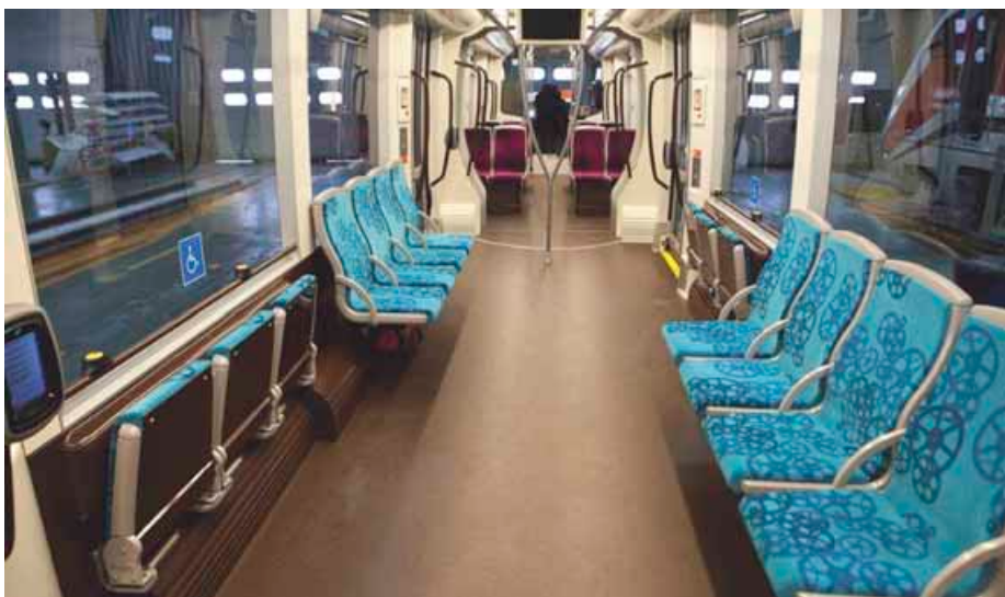
↑ LES DEUX EMPLACEMENTS RÉSERVÉS AUX FAUTEUILS ROULANTS SE SITUENT AU CENTRE DE LA RAME.