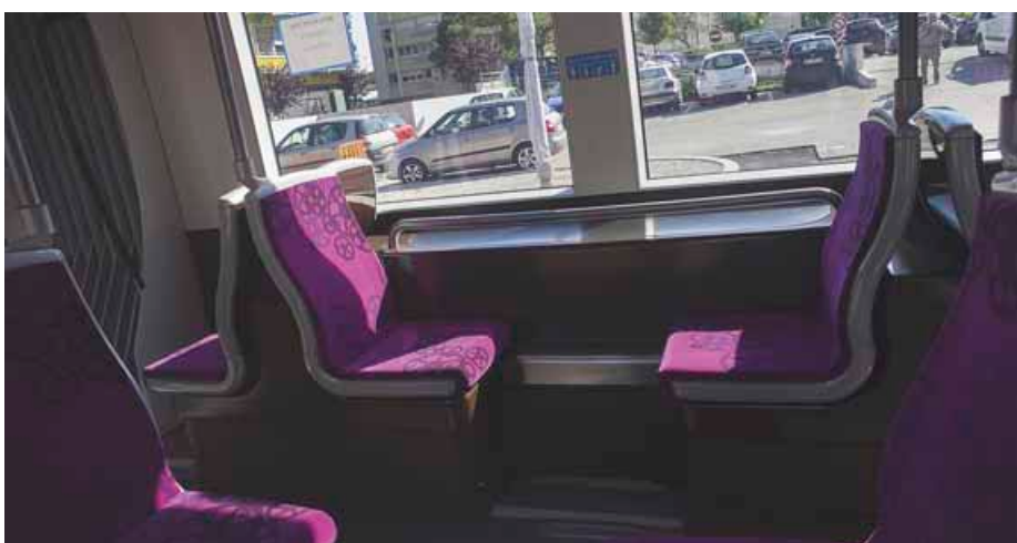
↑ 38 PLACES ASSISES DONT CERTAINES SONT RÉSERVÉES POUR LES PERSONNES PRIORITAIRES TELLES QUE LES PERSONNES ÂGÉES, LES FEMMES ENCEINTEES...

Architecture au sein de l'équipe de maîtrise d'œuvre. C'est en partie grâce à ce travail de concertation que le tram répondra en tout point aux exigences de l'arrêté du 13 juillet 2009, relatif à la mise en accessibilité des véhicules de transport public.»