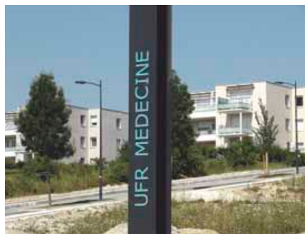
22 JUILLET 2013 : LA STATION UFR MÉDECINE INDIQUÉE SUR LE POTEAU LAC. PHILIPPE MIROUDOT